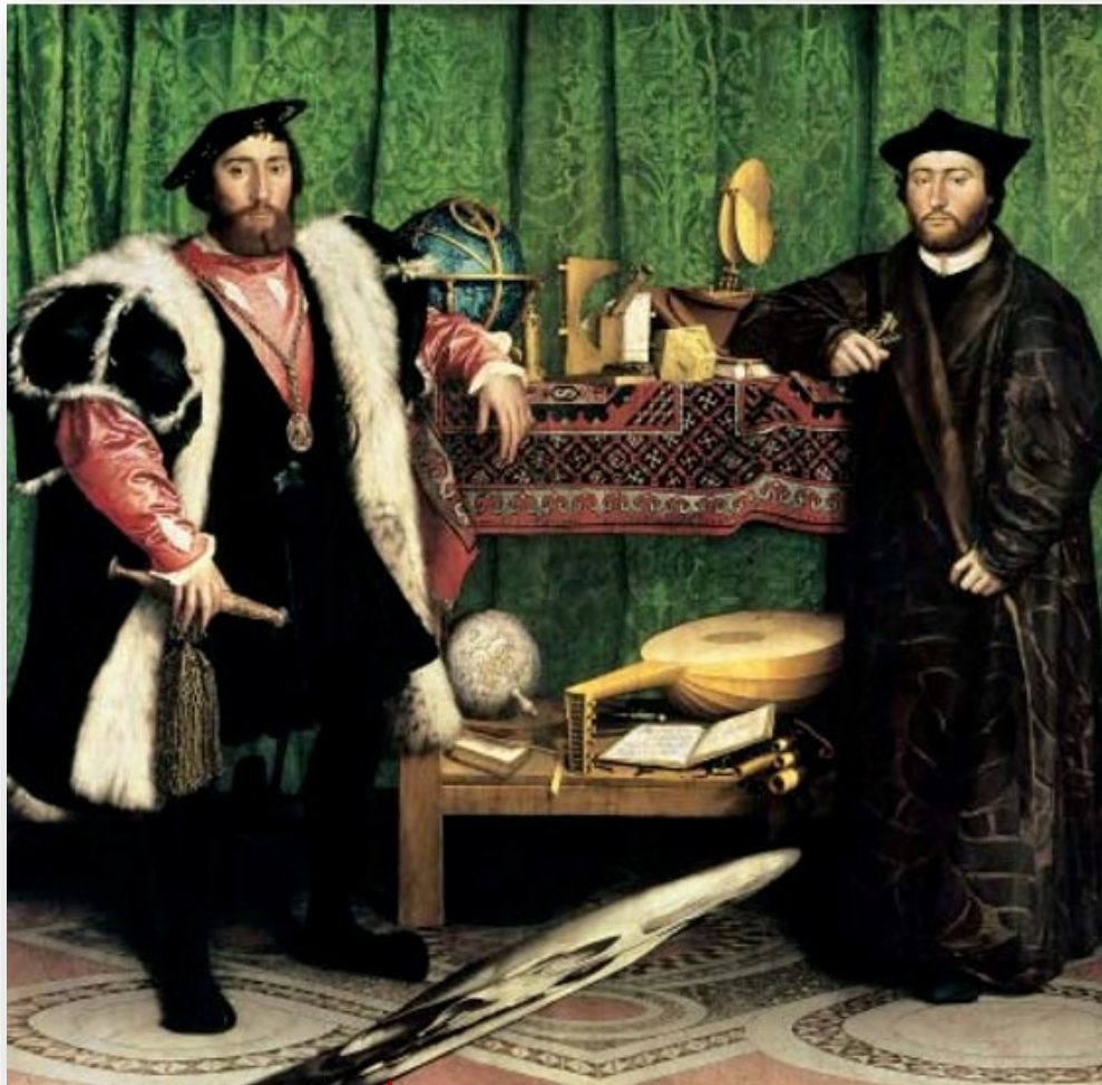
Hans Holbein le Jeune, Les Ambassadeurs, 1533. Huile sur bois (2,07 x 2,09 m), National Gallery, Londres.